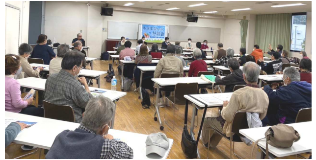
南区懇談会の様子

南区は64人、保土ヶ谷区は36人が参加しました。両区で寄せられた共通の要望は下記の通りです。