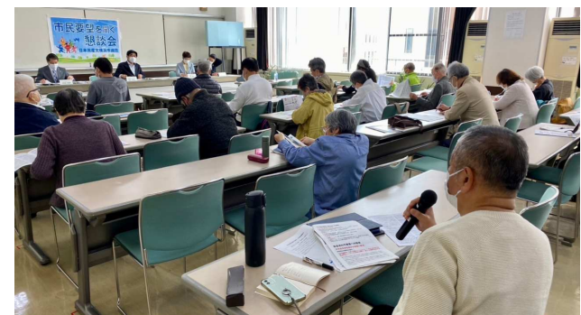
保土ヶ谷区懇談会の様子

実現・改善に向けて、議会で役割発揮できるよう頑張ります。今後も出張懇談会を行っていく予定です。ぜひ、ご参加ください。