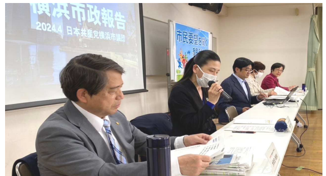
寄せられたご要望・ご質問に担当議員が回答しました