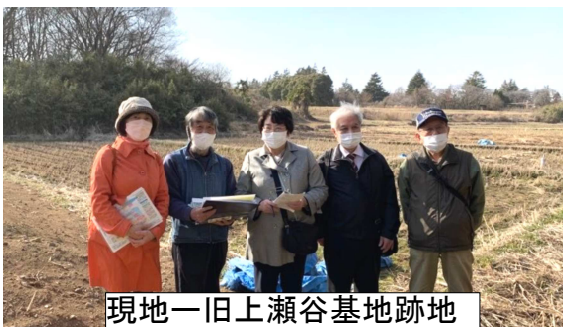
現地一旧上瀬谷基地跡地