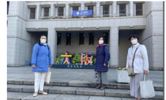
大阪市政府本庁舎前