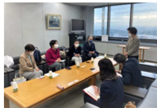
堺市教育委員会との懇談