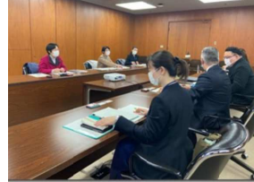
大阪市教育委員会との懇談