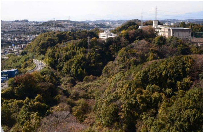
横浜市が、区域区分の変更で、住宅や商業施設建設を可能にしようとしている上郷深田地区